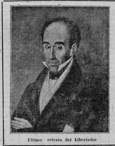
Ultimo retrato del Libertador