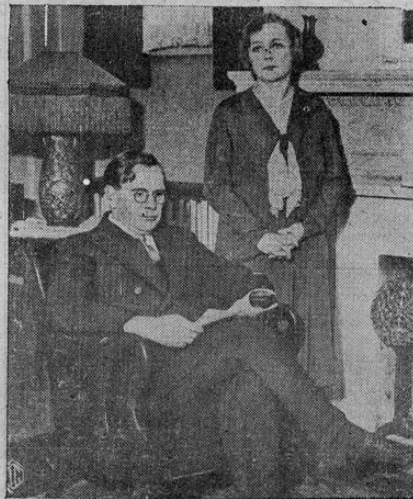
William N. Doack, nuevo secretario del trabajo en el gabinete del presidente Hoover, retratado con su esposa en su residencia cerca de Washington, al recibir la noticia de su nombramiento