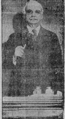
El vice presidente de los Estados Unidos, Charles Curtiss, en el momento de inaugurar el septuagésimo tercer congreso

Reserve su mesa con anticipación y pida informes a la administración del Hotel.