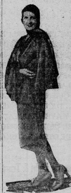
Los abrigos con capa serán muy populares durante la estación de invierno. Artista aparece una muy elegante de color ladrillo

En números redondos el presupuesto quedará reducido a veinticuatro millones de colones.