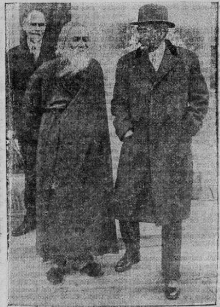
Rabindranath Tagore, poeta y sabio hindú, vestido con su traje nativo, saltando de la Casa Blanca, en Washington, acompañado del Embajador británico, Sir Ronald Lyndsay, después de una conferencia con el presidente Hoover.