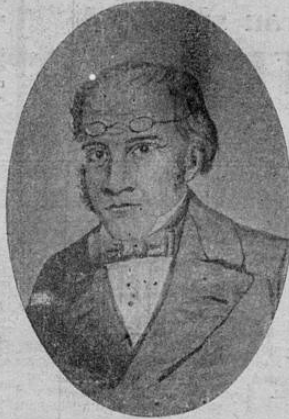
Don Simón Rodríguez el maestro de Bolívar